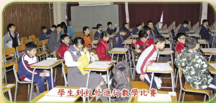
學生到校外進行數學比賽