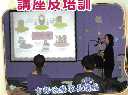
言語治療家長講座