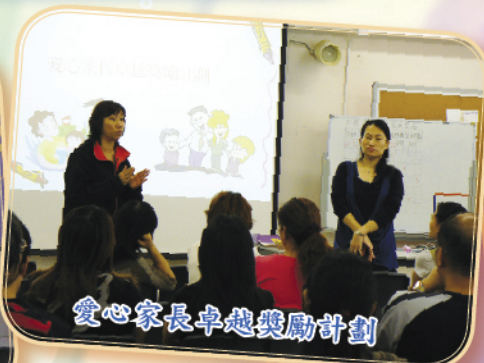
愛心家長卓越獎勵計劃