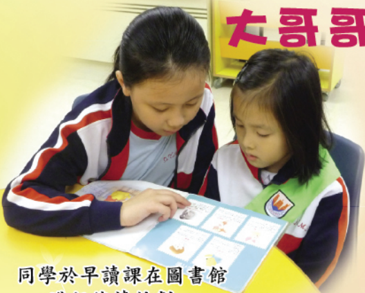
同學於早讀課在圖書館進行伴讀計劃。