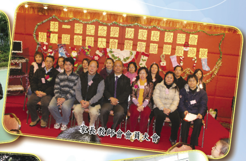
家長教師會會員大會