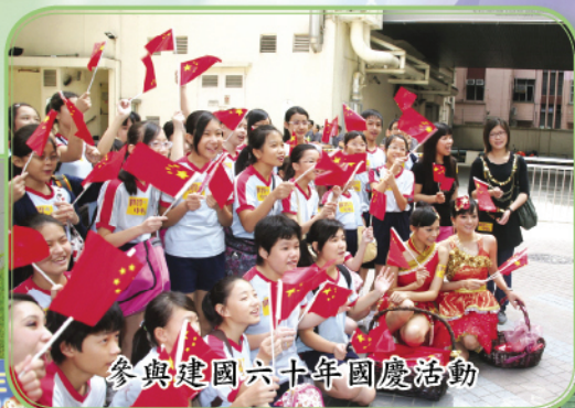
參與建國六十年國慶活動