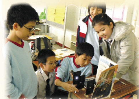
同學於課堂中透過親身的實踐，從而得知光是以直線進行。