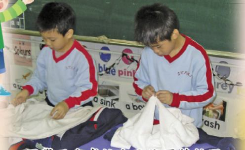
同學正在考核自己能否替校服扣好鈕扣及拉上拉鍊。