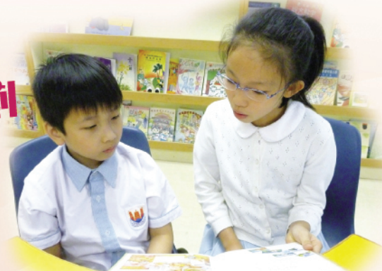
伴讀大使與低年級同學一起閱讀圖書。

中文科與圖書科合作推行大哥哥大姐姐伴讀計劃，讓低年級同學在高年級同學的協助下進行課外閱讀，減低閱讀時所遇到的困難，培養閱讀的興趣和信心，提升閱讀能力。此計劃亦加強高低年級同學之間的溝通和思想交流，培養學生守望相助、同儕共勉的品德。