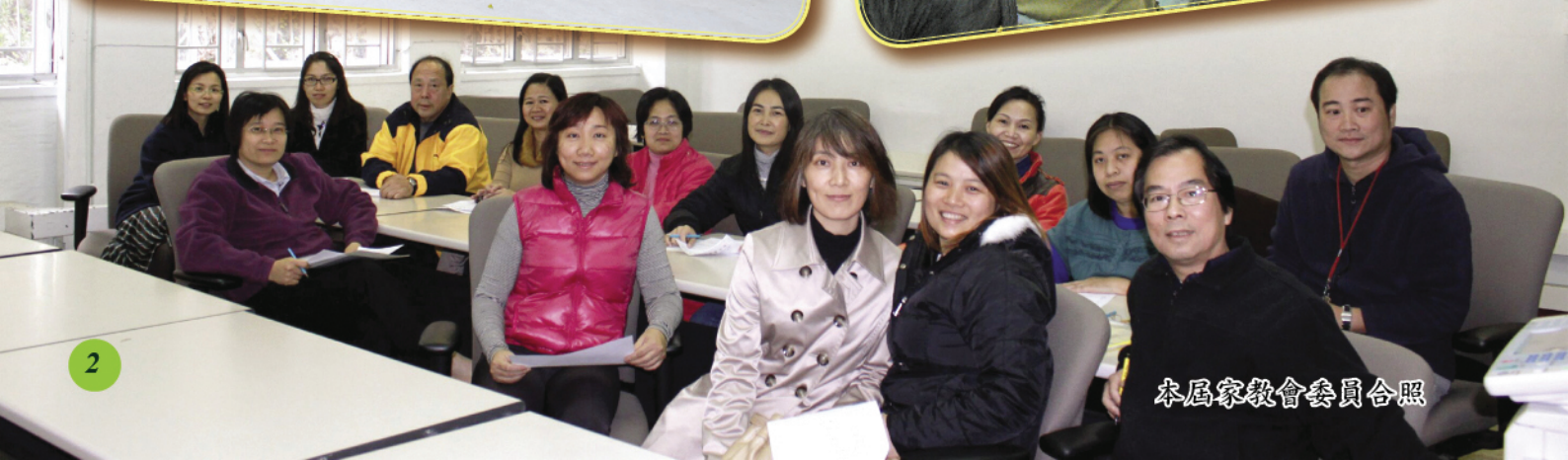
本屆家教會委員合照