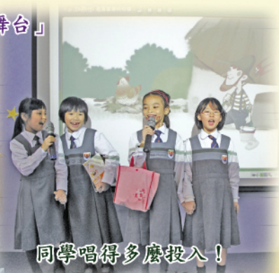
同學唱得多麼投入！