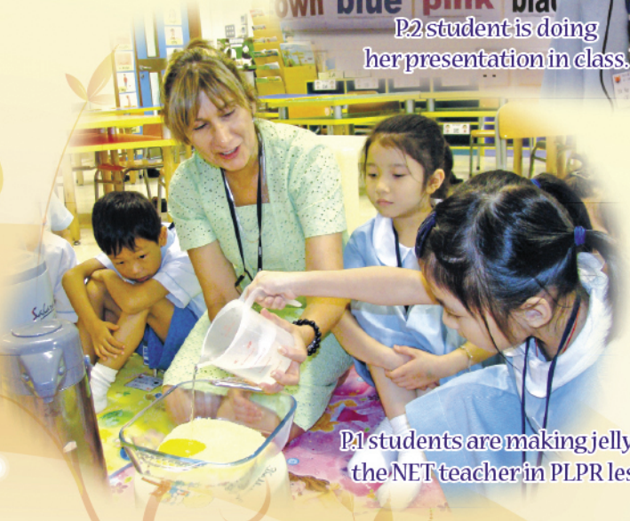
P1 students are making jelly with the NET teacher in PLPR lesson.