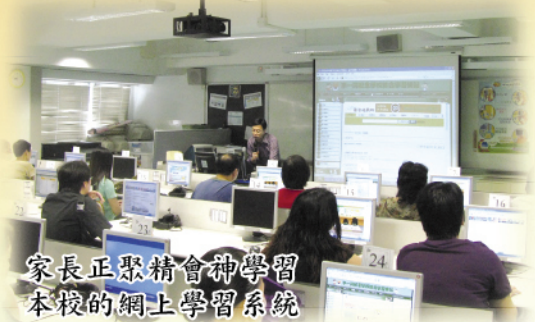
家長正聚精會神學習本校的網上學習系統