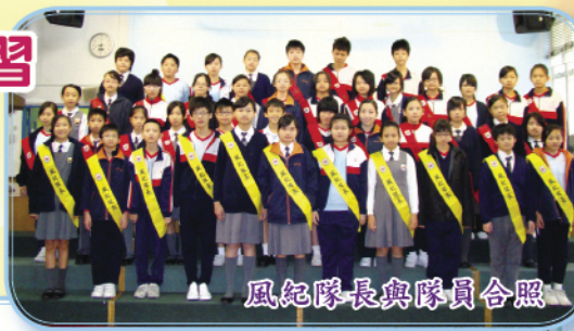
風紀隊長與隊員合照