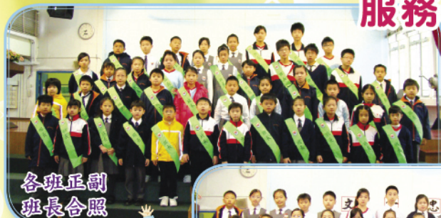
各班正副班長合照