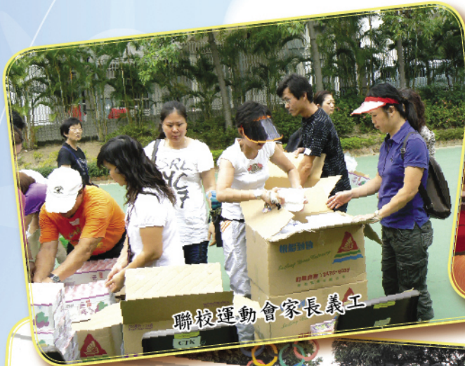
聯校運動會家長義工