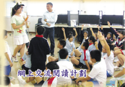
網上交流閱讀計劃

家長講座、早讀課、大哥哥大姐姐伴讀計劃、自備圖書我至醒、借閱龍虎榜、讀書會、好書推介、主題閱讀、網上交流閱讀計劃（與嶺南大學合作）、Jolly Reading Scheme、親子設計比賽和家長義工協助圖書館工作等。