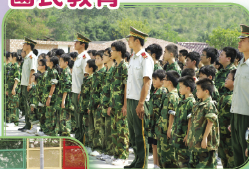
廣州軍旅體驗——步操訓練