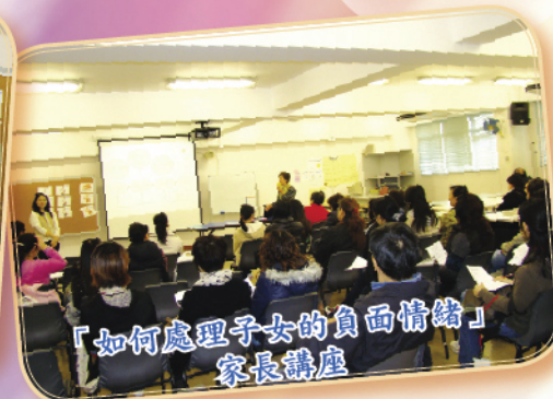
「如何處理子女的負面情緒」家長講座