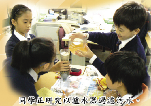
同學正研究以瀘水器過濾污水。