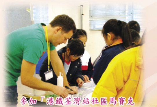
參加「港鐵荃灣站社區馬賽克創作計劃」——藝術家駐校帶領師生進行工作坊