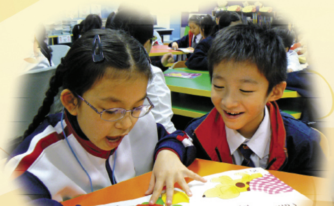
P3 students are shared-reading with P2 students in Buddy Reading Scheme.