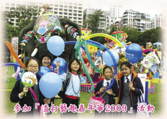
參加「渣打藝趣嘉年華2009」活動