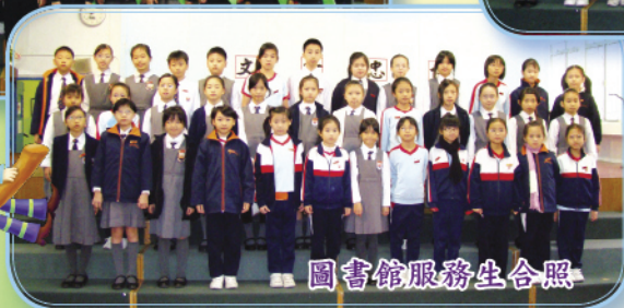
圖書館服務生合照