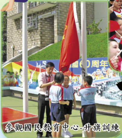
參觀國民教育中心-升旗訓練