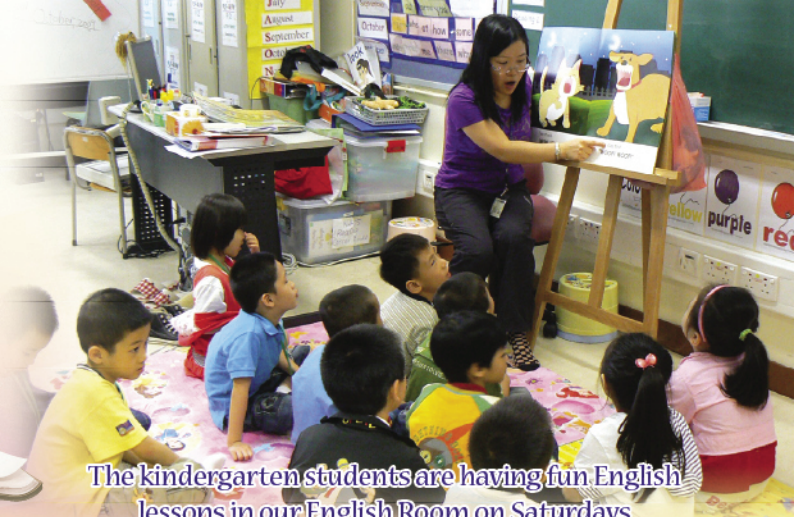
The kindergarten students are having fun English lessons in our English Room on Saturdays

Aiming at enhancing our students' English language skills on listening, speaking, reading and writing as well as promoting their interest in learning English, our school has been organizing different enjoyable and educational learning activities and programmes such as PLPR/W Program for P.1 and P.2, English Angels Scheme, Buddy Reading Scheme, English Drama Club, Phonics Class, Theme-based learning activities (Mid-autumn Festival Riddles, Halloween Activity) etc, in which students are able to learn in a high quality, conducive and pleasant English learning environment.