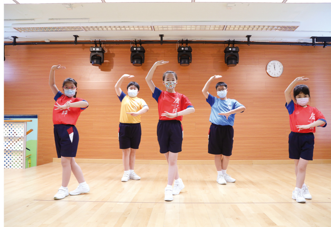
學校在幾年前已開展粵劇活動，讓小朋友透過參與粵劇表演，體驗中國文化的優秀傳統，做到傳承的效果。