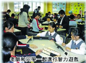
老師和同學一起進行智力遊戲

趣味數學班簡介 ——學生於趣味數學班學習奧數、高層次的思維模式及不同的解難能力。同學透過遊戲、競賽、觀察、討論、交流和合作，以提升數學思維及數學能力。照片中，同學就正進行一種訓練思維能力的遊戲——魔力橋（Rummikub）。