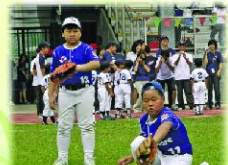
同學們全神貫注地接住了回球，充分發揮接球的技巧。