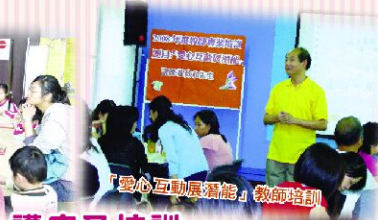
「愛心互動展潛能」教師培訓