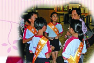
禮貌大使向港鐵乘客宣揚乘車禮貌及安全訊息