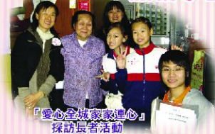
「愛心全城家教進心」探訪長者活動