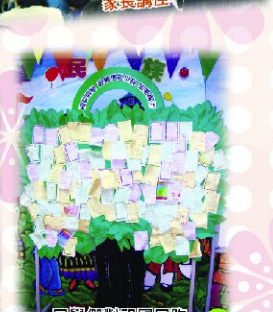
同學們對祖國同胞獻上關懷。