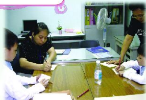
課後小一英文提升班

「家長課程」是為了提升孩子學習的興趣、成效及自信心；又可以增加父母長輩與子女溝通的話題，改善親子關係。成為子女終身學習的好榜樣。