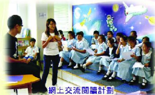
網上交流閱讀計劃