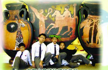
參觀大英博物館珍藏展