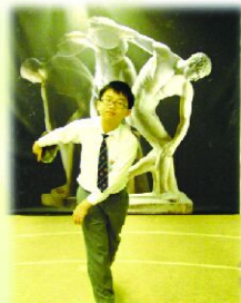
同學擲鐵餅的姿態多威風！

於2008-2009年度，本校繼續參與優質教育基金推行的資優教育學校網絡計劃(第二期)，由中文科及視藝科合辦資優課程——「小小書畫家」。此課程之對象為本校在中文寫作及視覺藝術兩方面均有卓越表現的五年級資優學生，課程的目的是啟發學生在中文寫作上的創意，並提升他們對書法藝術及繪畫技巧的掌握，培養學生審美的情趣、批判性思考能力、協作能力及溝通能力。課程內容包括個人創作、集體創作、分組活動、小組討論、作品欣賞、學生自評、同學互評、參觀活動等。