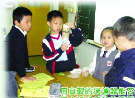
用自製的過濾器能否把污水過濾得乾乾淨淨？