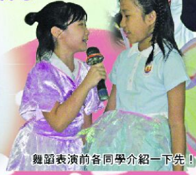
舞蹈表演前各同學介紹一下先！