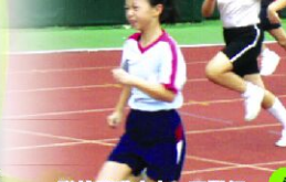
聯校運動會上，同學們都全力以赴，向着終點奔馳。