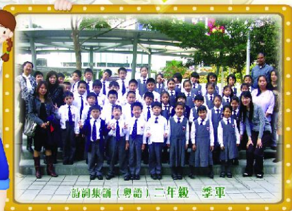
詩詞集誦 (粵語) 二年級 季軍