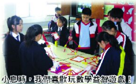
小息時，我們喜歡玩數學益智遊戲！