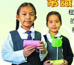
這是同學親手製作的不倒翁。

小學常識科是門綜合的學科，課程以「探究」為本，目的是為了訓練學生的思考和提升學生的學習能力。因此，本校的常識科課程在各級均加入「手腦並用」的有意義的課堂活動。此外，在一年級的課程內，更設有生活技能課，培養學生的自理能力。