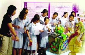
參觀2008中秋燈籠設計展覽