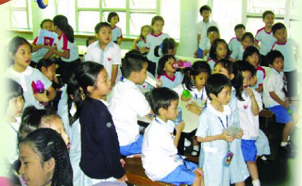
看！同學多麼投入地欣賞！！