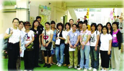
家長義工協助聯校運動會