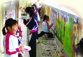
「中國改革開放三十年之 開聯與娛樂」壁畫創作