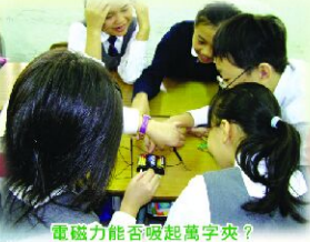
電磁力能否吸起萬字夾？