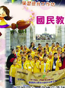
「同根同心」內地交流計畫——途仙故地：讓學生透過親身經歷，加深對中國歷史和文化的認識。