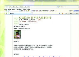
老師網上好書推介