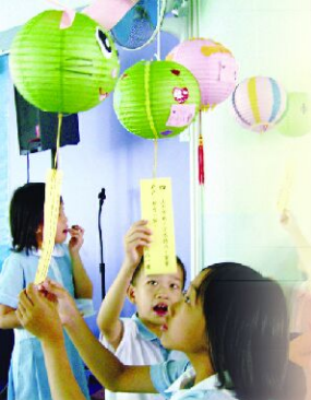
同學聚精會神地猜燈謎，十分投入。

中文科 配合中國傳統節慶，與其他科組跨科推行相關的學科活動，讓學生從活動中認識中國文化及學習語文知識，如在中秋節前夕與英文科、常識科及視藝科舉行「 同慶中秋猜燈謎 」比賽，在十月一日國慶節期間與音樂科合辦「 認識國歌 」活動等。