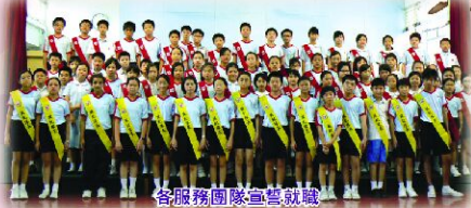
各服務團隊宣誓就職