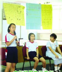
六年級學生正進行學生代表模擬選舉。