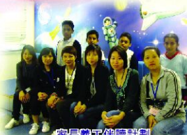
家長義工伴讀計劃