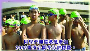
同學們無懼寒風參加2006香港公開冬泳錦標賽。

本校體育科課程設計著重增進兒童之健康，促進神經、肌肉、骨骼及身體各部官能，使身體獲致全面的發展及良好的體適能，特別在低年級課程加插花式跳繩，高年級加插游泳課程，提供練習多元化的學習機會，養成鍛鍊體魄的良好習慣。