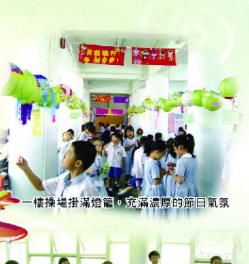
一樓操場掛滿燈籠，充滿濃厚的節日氣氛。

音樂科 於今年成立「音樂舞台」，讓同學於小息時段欣賞音樂及進行表演活動，發揮他們的音樂才華及潛能。內容包括：聽歌學英文、聽歌學普通話、自選點唱及「我有我的舞台」表演活動等，令他們有一個既愉快又充實的小息。