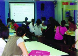
閱讀越進步家長講座