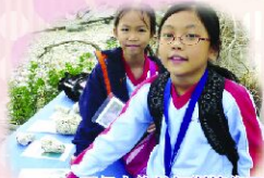
環保大使於坪洲搜集了很多珊瑚的化石呢