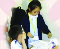
愛心大使指導和照顧同學