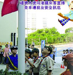
同學們踴躍參加莊嚴的升旗禮！