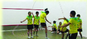
同學們掌握了「花式跳繩」的竅門，努力練習。