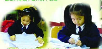
這兩位一年級同學正在練習扣鈕扣和拉生拉鍊，準備給老師和同學評分。