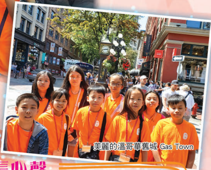
美麗的溫哥華舊城 Gas Town