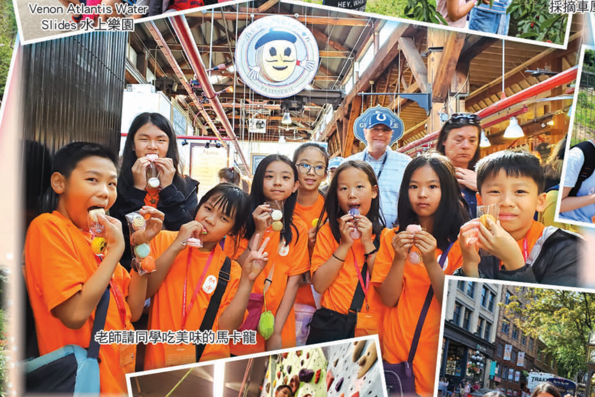
老師請同學吃美味的馬卡龍