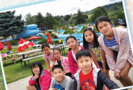
Venon Atlantis Water Slides 水上樂園