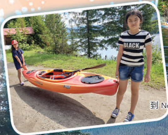
到 North Barrier Lake 划獨木舟