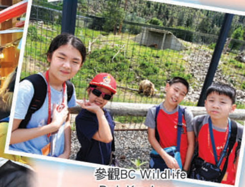
參觀BC Wildlife Park Kamloops