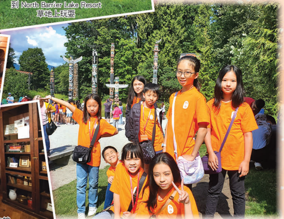
暢遊溫哥華 Stanley Park