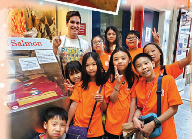
加拿大的三文魚真是名不虛傳