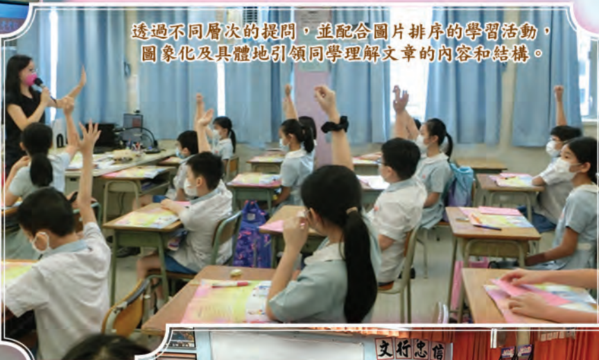
透過不同層次的提問，並配合圖片排序的學習活動，圖象化及具體地引領同學理解文章的內容和結構。

計劃的大學專業人員到校舉行教師專業發展工作坊，向本校教師介紹適異教學的理念，與教師團隊建立共識。