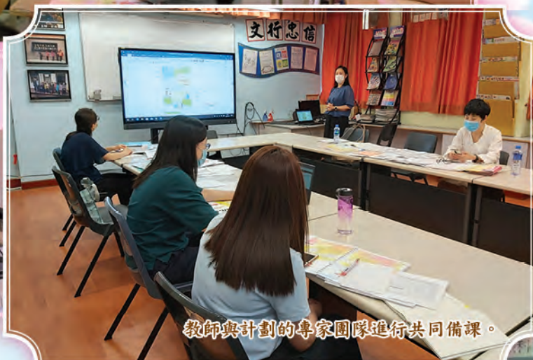
教師與計劃的專家團隊進行共同備課。