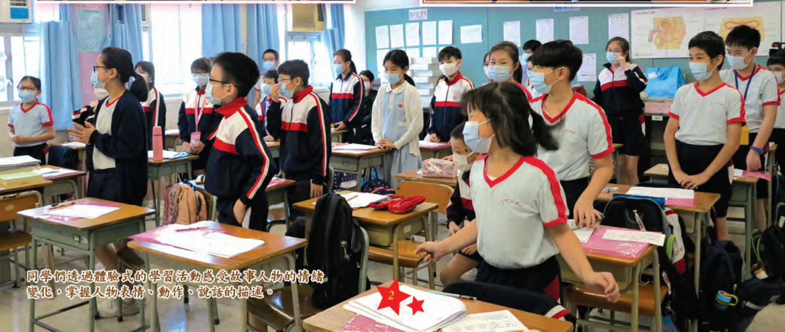
同學們透過體驗式的學習活動感受故事人物的情緒變化，掌握人物表情、動作、說話的描述。