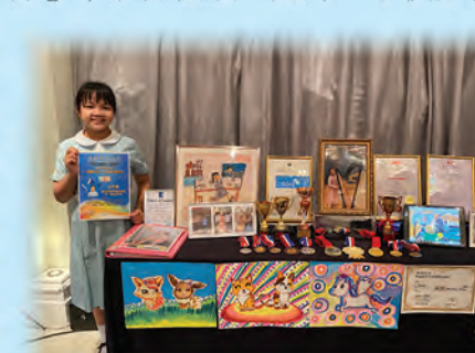
資優教育基金才華拓展獎學金

本校學生多次獲得由「資優教育基金」頒發的「閃耀之星」才華拓展獎學金，更有本校學生獲香港中文大學取錄，得以參加由大學舉辦的資優課程，這足以證明我校同學的努力得到各界充份的肯定。