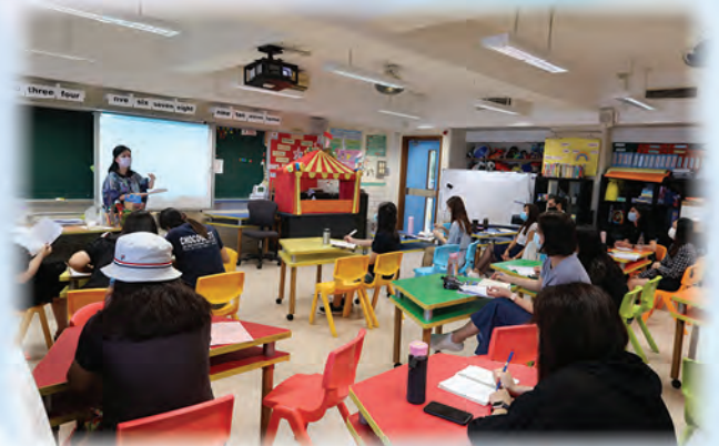
學科教師專業發展工作坊