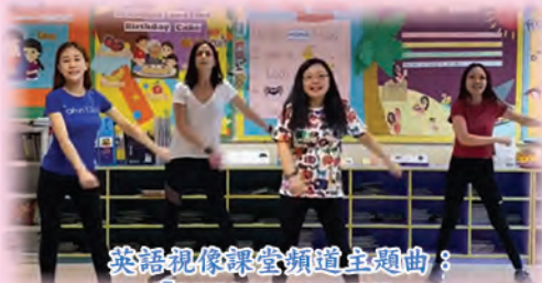
英語視像課堂頻道主題曲： 「LYN Kinder TV」