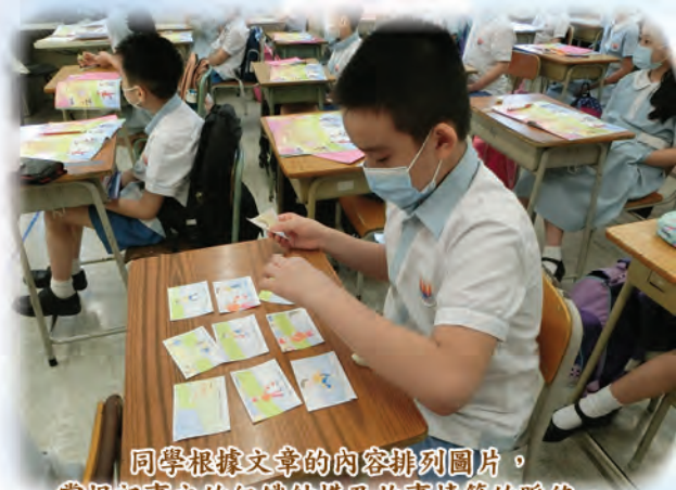
同學根據文章的內容排列圖片，掌握記事文的組織結構及故事情節的脈絡。

本年度五年級中文科參與「賽馬會校本多元計劃」，本校教師透過與大學專業人員的協作，在課堂教學中實踐適異教學 (Differentiated Instruction) 的理念，優化課堂的教學設計，靈活而有效地照顧學生不同的學習風格及需要，並擴展學生的學習空間，以達致所訂的學習目標。