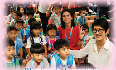
Playing is Learning

為了讓即將成為小一的學生作好升小學的準備，學校特意設計了「Playing is Learning」幼小銜接課程、「LYN Kinder TV」英語視像課堂頻道及到校課堂。課程以小朋友的學習興趣及需要出發，以學習英文為主，輔以音樂、視藝、體育及STEM元素，好讓幼稚園學生在上小一前作好準備，成為喜愛學習英語的學生！