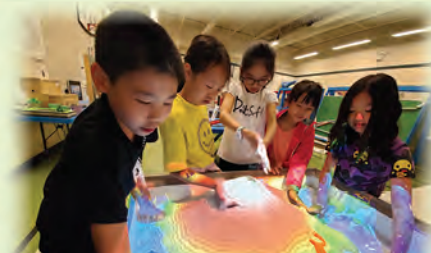
Little Science Museum Exploration

本校每年都會安排學生到街頭訪問外國遊客，以增強他們運用英語的能力，學習與人溝通，有效提升他們英語會話的能力與信心。此外，學校每年均舉辦加拿大境外交流活動、英語話劇及訪問遊客活動，以鼓勵學生走出課室，活用英語。參與加拿大遊學團的同學會到當地學習及交流兩周，他們會入住當地寄宿家庭，學生在良好的語言環境下，以英語與當地人溝通及相處，他們還會到大學校園學習，感受不一樣的上課氣氛，更會參觀博物館、野生動物園，參與划獨木舟和到果園摘生果等活動，全方位體驗當地居民的生活習慣和文化。