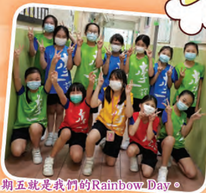
每逢星期五就是我們的Rainbow Day。

每逢星期五都是別具意義的日子，就是我校獨有的「LYN Rainbow Day」——彩虹親親「李」了。