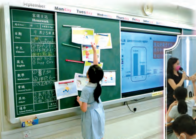
透過圖片排序的學習活動，同學組織文章起、承、轉、合的情節發展。