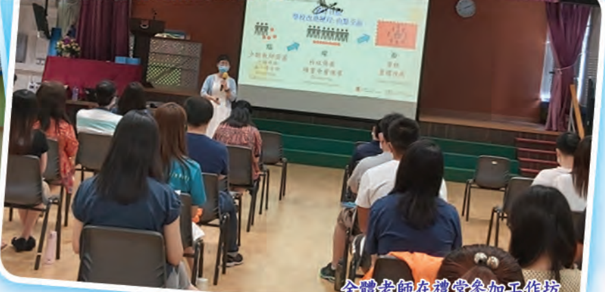
全體老師在禮堂參加工作坊