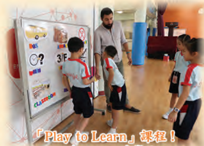
「Play to Learn」課程！ 一邊玩，一邊學！