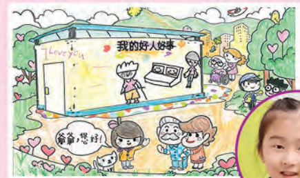
1D 陳靜妍 初小組優異獎