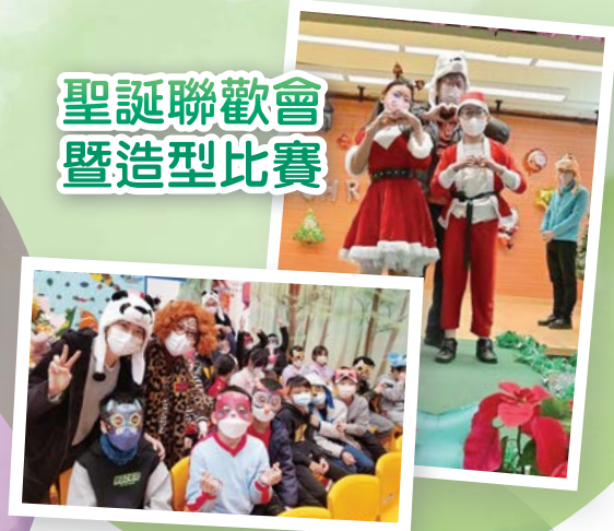
聖誕聯歡會暨造型比賽