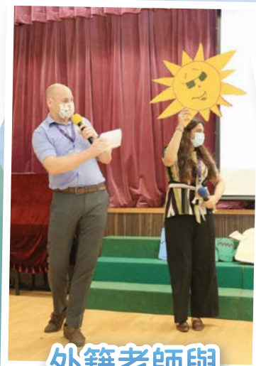
外籍老師與 幼稚園同學 進行英語體驗課