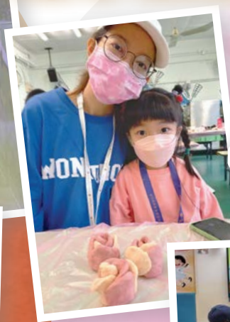
家長班： 「玫瑰饅頭 工作坊」及 「畫圖畫建立 親子關係」