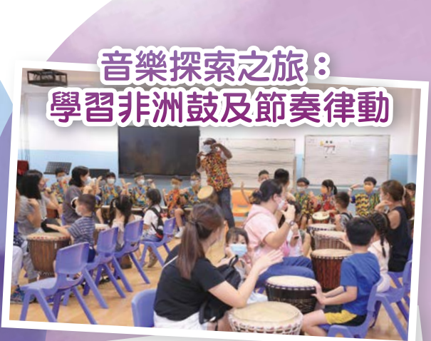
音樂探索之旅： 學習非洲鼓及節奏律動