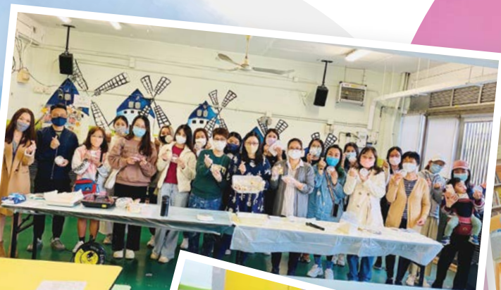
家長老師 合製美食