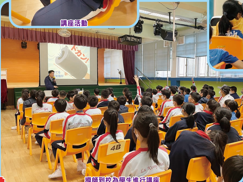
導師到校為學生進行講座