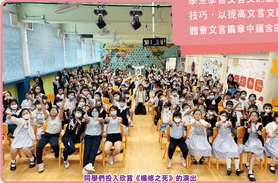
同學們投入欣賞《楊修之死》的演出

五年級學生參與了由「7A班戲劇組」主辦的「賽馬會『趣看文言』戲劇教育計劃」，透過運用戲劇教學手法中「視覺化閱讀」的特點，提升學生學習文言文的動機；並向學生介紹文言閱讀技巧，以提高文言文課堂的學與教效能，讓同學體會文言篇章中蘊含的中華文化精髓。