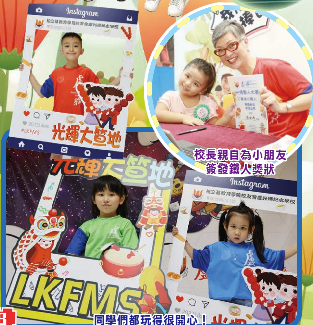
同學們都玩得很開心！