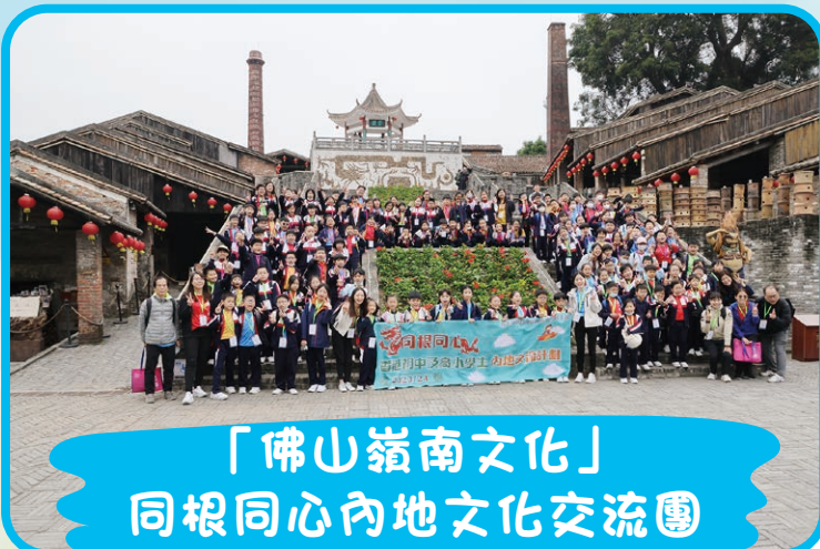
「佛山嶺南文化」 同根同心內地文化交流團