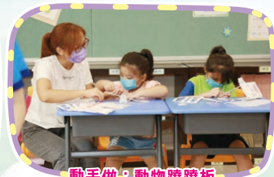
動手做：動物蹺蹺板