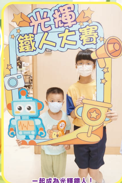
一起成為光輝鐵人！