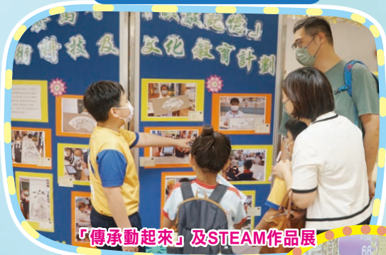
「傳承動起來」及STEAM作品展