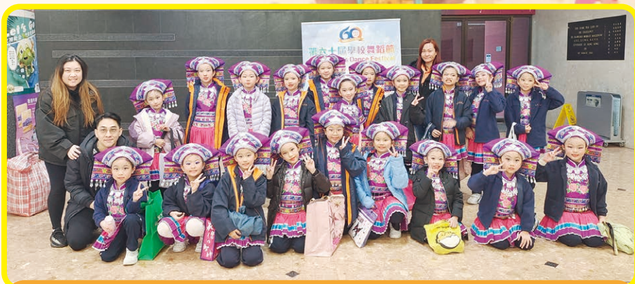
第六十屆學校舞蹈節 中國舞 甲等獎