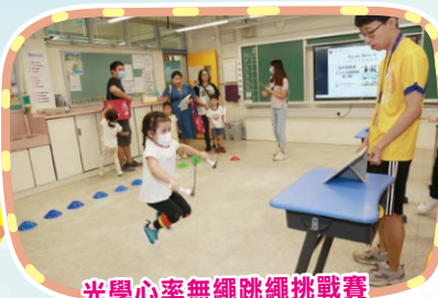
光學心率無繩跳繩挑戰賽