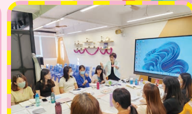
中文、英文、數學及常識科主任參與「QSIP中層領導培育學習圈」