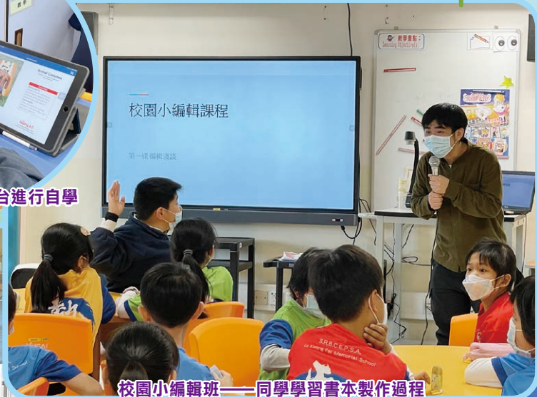
校園小編輯班——同學學習書本製作過程