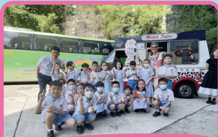
「癸卯兔年慶中秋 光輝同行雪糕日」