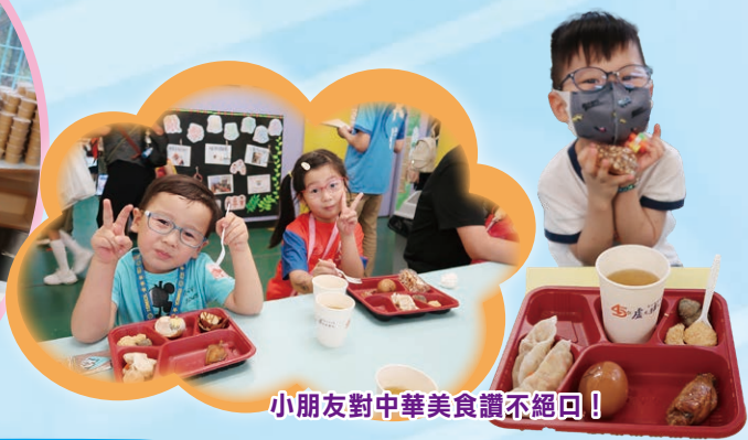
小朋友對中華美食讚不絕口！