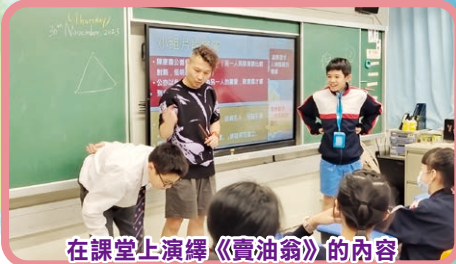
在課堂上演繹《賣油翁》的內容