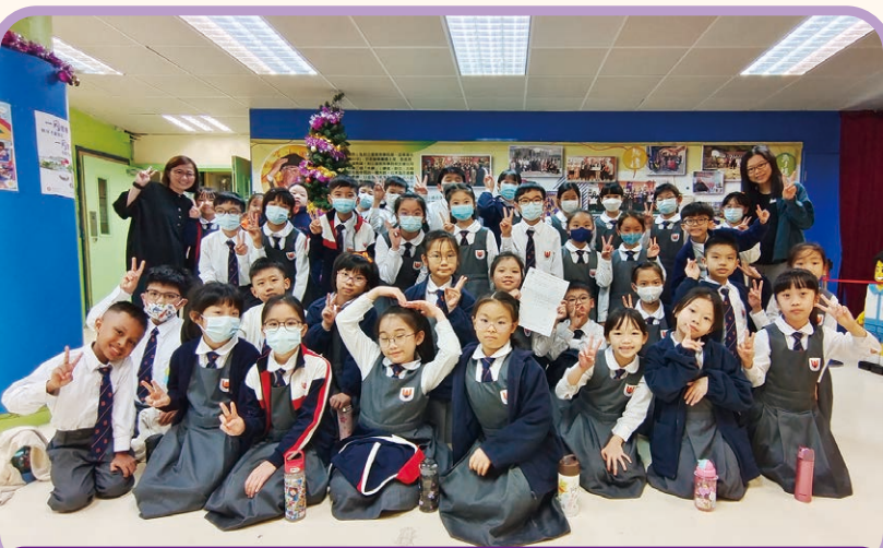
小學三、四年級粵語集誦 優良