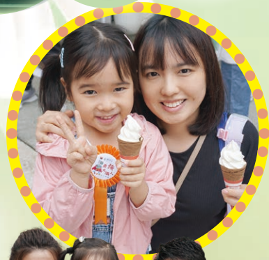
完成指定任務，成為光輝鐵人後，可獲得大人和小朋友都喜愛的軟雪糕！