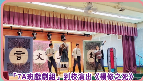
「7A班戲劇組」到校演出《楊修之死》