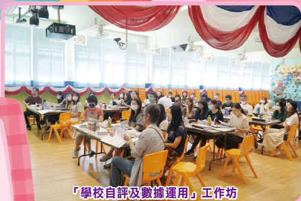
「學校自評及數據運用」工作坊

為推動教師的專業發展，本校每年都會舉辦不同類型的教師專業發展活動，讓教師能與時並進，提升在各個專業範疇的素養，促進個人的專業成長。