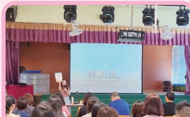
教育局「T-標準+」培訓資源套分享及討論