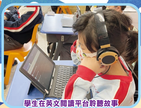
學生在英文閱讀平台聆聽故事