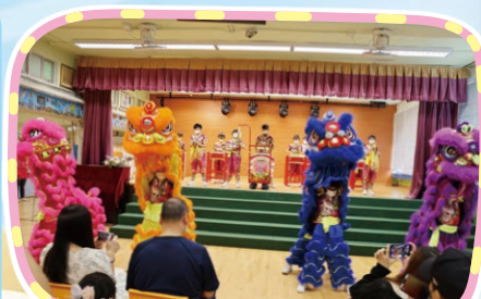
本校獅藝隊和中國鼓校隊進行開幕表演！