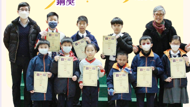
2023粵港澳大灣區數學精英盃大賽 (香港賽區)