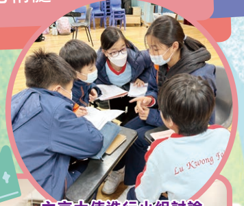
文言大使進行小組討論