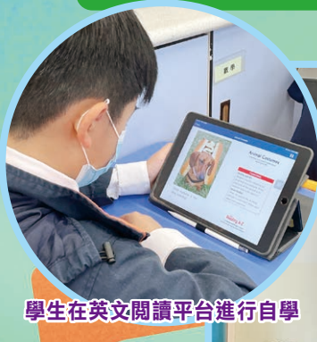
學生在英文閱讀平台進行自學