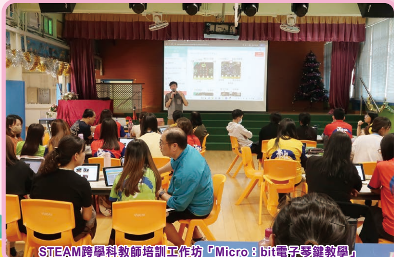
STEAM跨學科教師培訓工作坊「Micro: bit電子琴鍵教學」