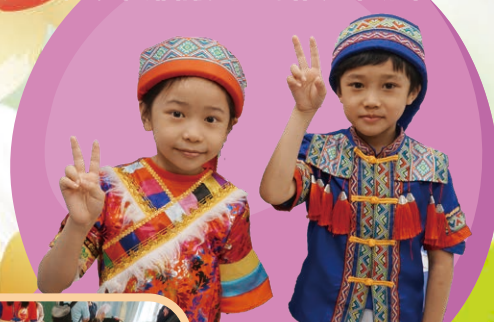
中國少數民族拍照區