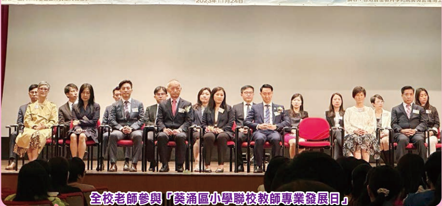
全校老師參與「葵涌區小學聯校教師專業發展日」