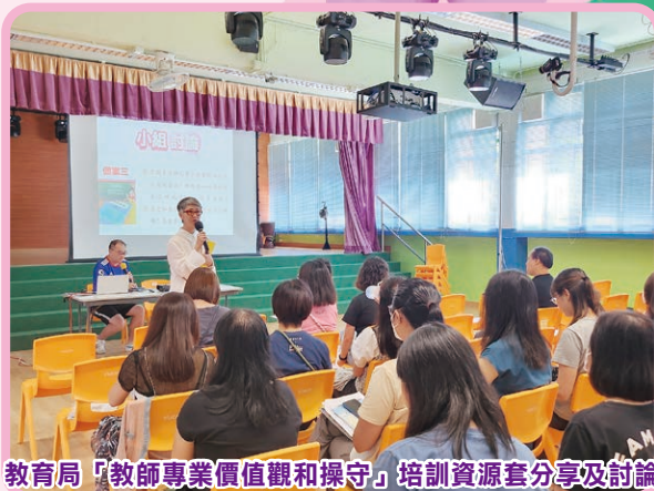
教育局「教師專業價值觀和操守」培訓資源套分享及討論