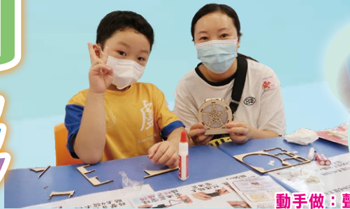
動手做：聲控拍拍燈