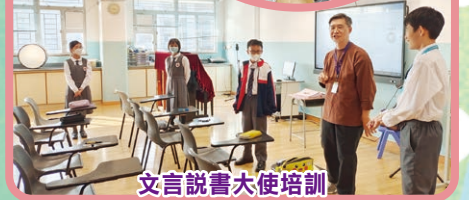
文言文說書大使培訓