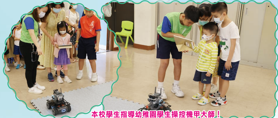
本校學生指導幼稚園學生操控機甲大師！