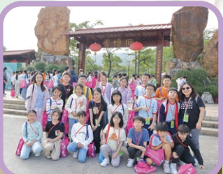
「珠海、澳門文化 交流」畢業遊學團